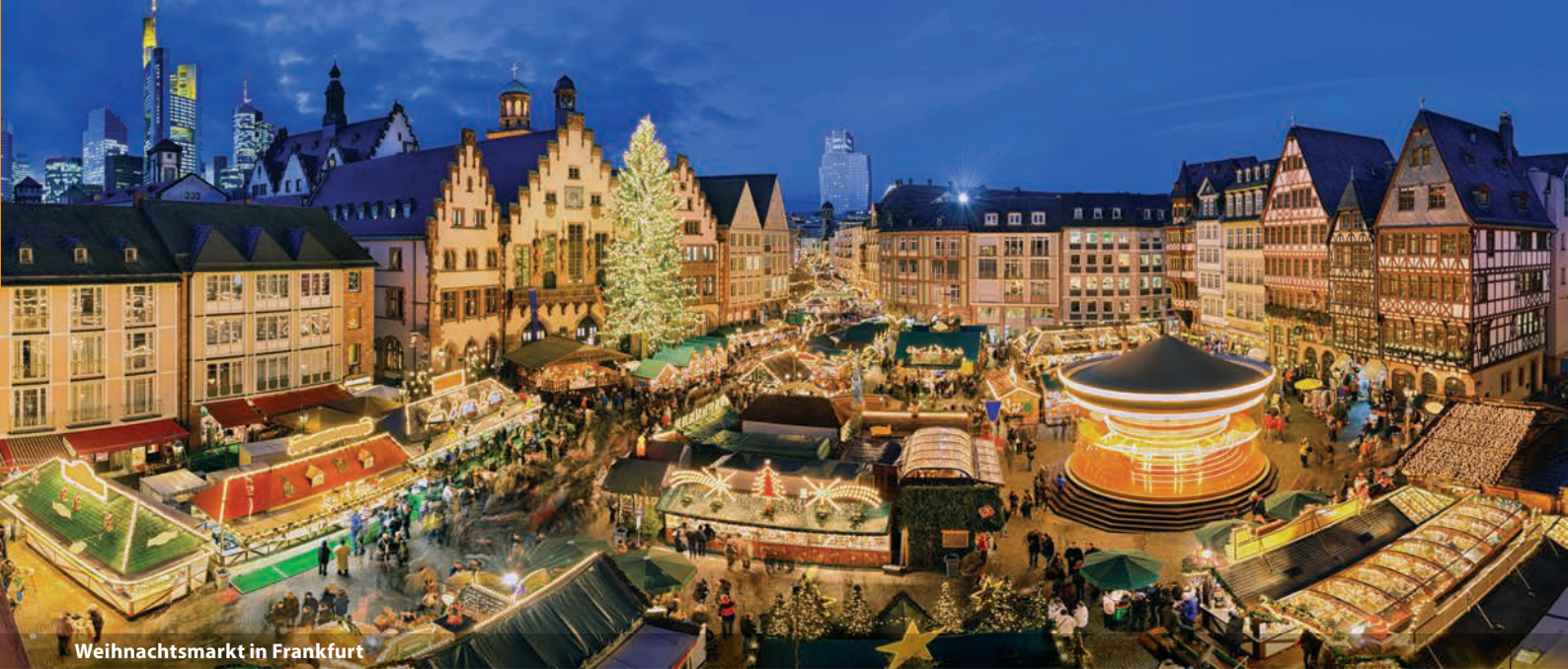
Weihnachtsmarkt in Frankfurt