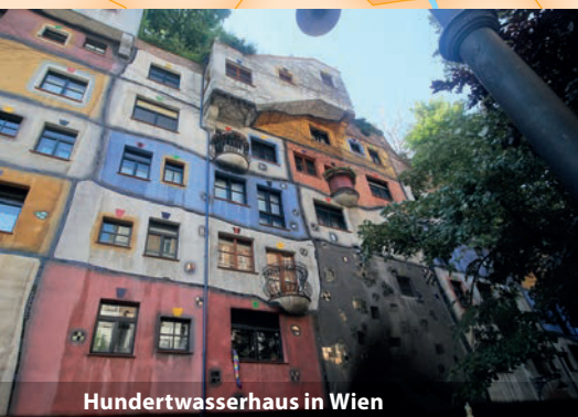
Hundertwasserhaus in Wien

sehen wir den gewaltigen Dom von Esztergom. Die Hauptstadt der Slowakei Bratislava ist die nächste Station unserer Reise. Sie besticht durch eine malerische Altstadt mit der alles überragenden Burg. Bei einem Stopp im beschaulichen Winzerstädtchen Dürnstein steht ein Ausflug durch die malerische Wachau auf dem Programm, bevor unsere erholsame und beeindruckende Reise in Passau zu Ende geht.