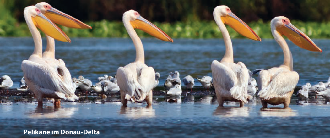
Pelikane im Donau-Delta