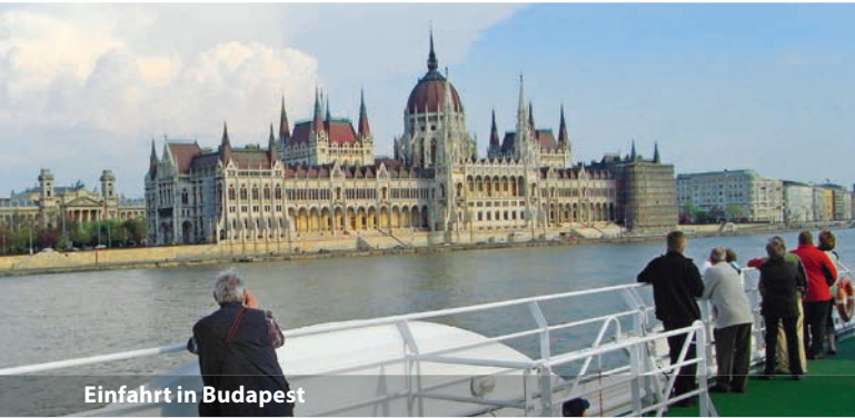
Einfahrt in Budapest