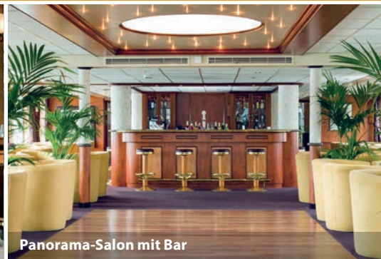
Panorama-Salon mit Bar