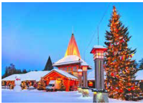
Postamt im Weihnachtsmandorf