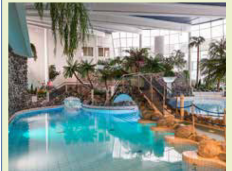
Im Spa-Bereich des Hotels