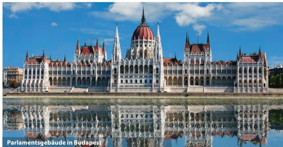
Parlamentsgebäude in Budapest

(A) = diese Ausflüge beinhaltet das preisreduzierte Ausflugs paket für 125,- € (Buchung mit Reiseanmeldung)