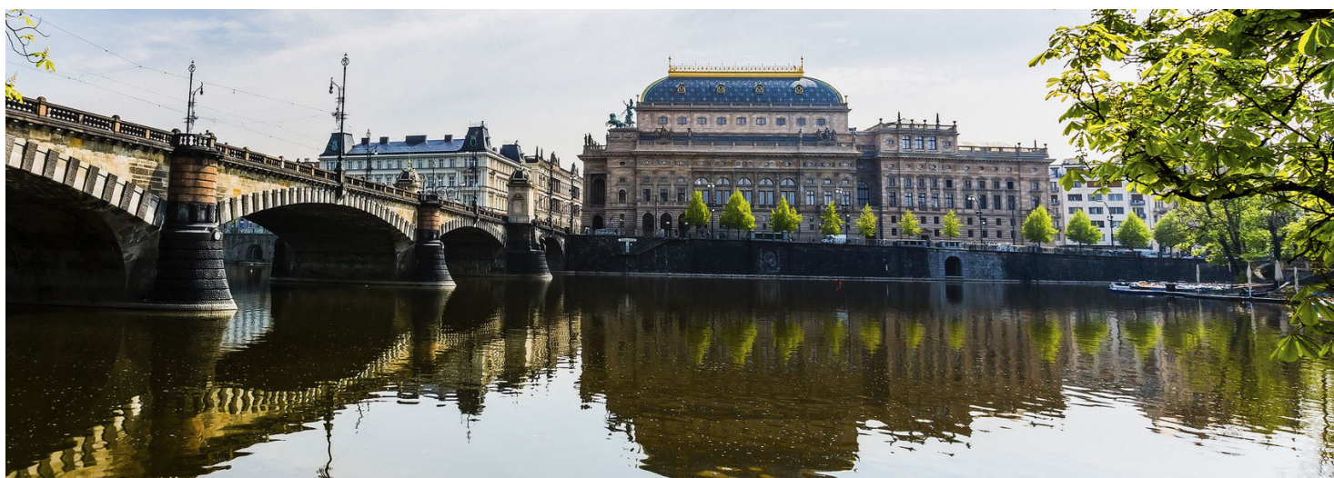
Nationaltheater Prag

Information & Buchung: Zeitungsverlag Aachen GmbH MedienhausReisen / Lesermarkt Dresdener Str. 3 52068 Aachen Tel. 0241 5101-710 Fax -147 Montag bis Freitag: 08:00 - 18:00 Uhr reisen@medienhausachen.de