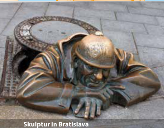
Skulptur in Bratislava

Eine unvergessliche Flusskreuzfahrt endet mit der Rückkehr nach Passau.