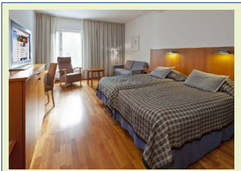
Beispiel Doppelzimmer groß