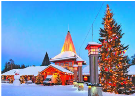
Postamt im Weihnachtsmanddorf